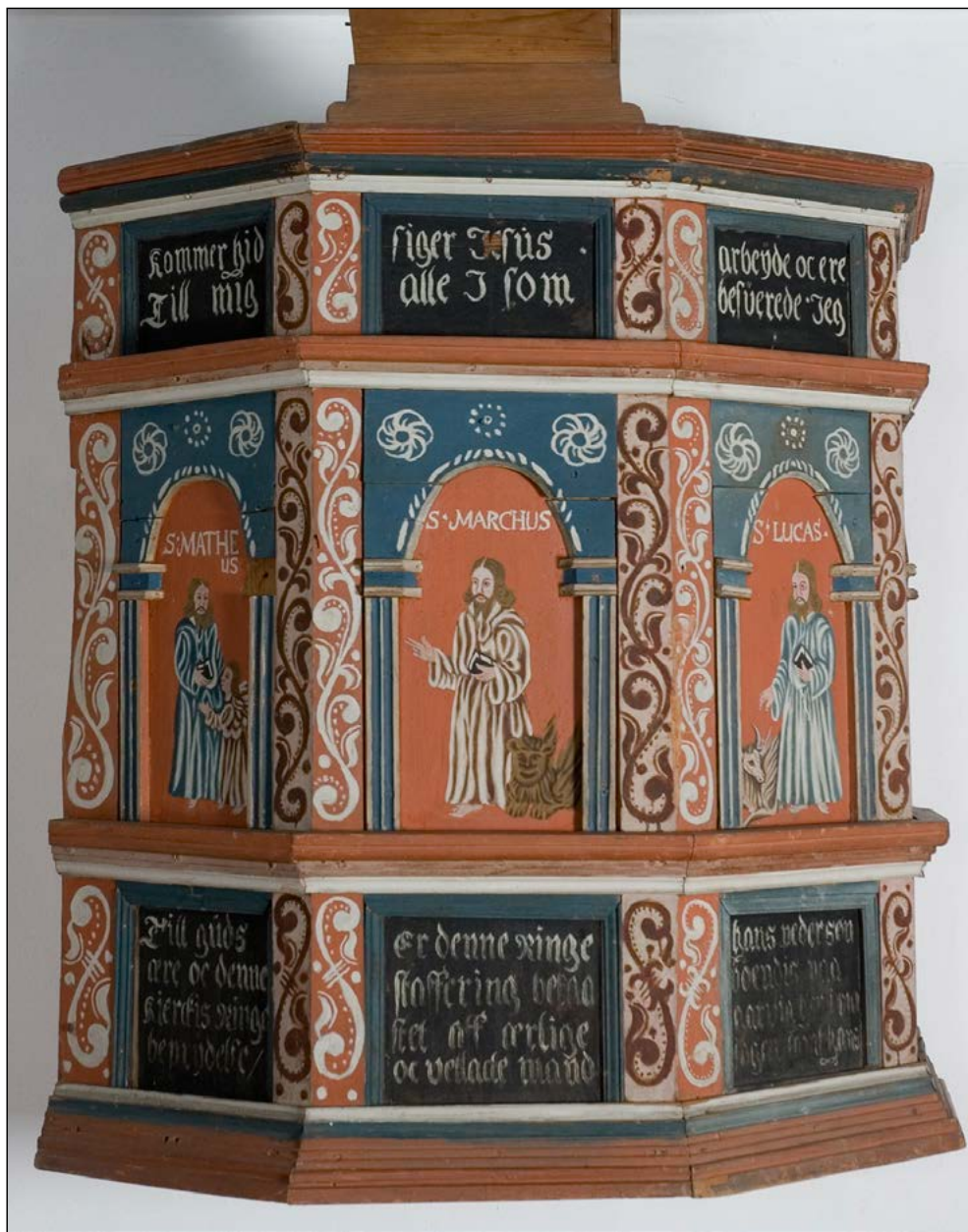
Prekestolen fra den gamle kirken i Sand.

for spontak, kanskje under reparasjonen i 1851-53. «Avfallsved» ble det også solgt fra den gamle kirken. Noen dører og vinduer ble også solgt, og det siste som nevnes i byggeregnskapene for den nye kirken er at før 16. september 1893 ble det solgt en dør for 5 kroner. I 1902 ble noen gjenstander fra den gamle kirken overdratt til Norsk Folkemuseum: En prekestol, en altertavle, et gammelt alterkors og tre mindre stykker sort tøy. Slik munner historien om de gamle kirkene i Nord-Odal ut.