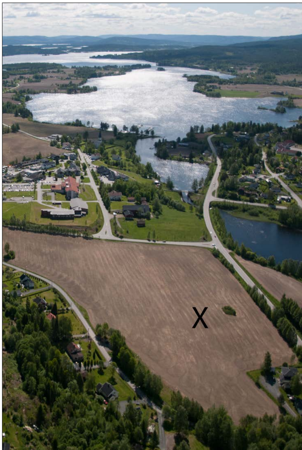
Stedet der kirken på Visbølbakken sto er markert med X.