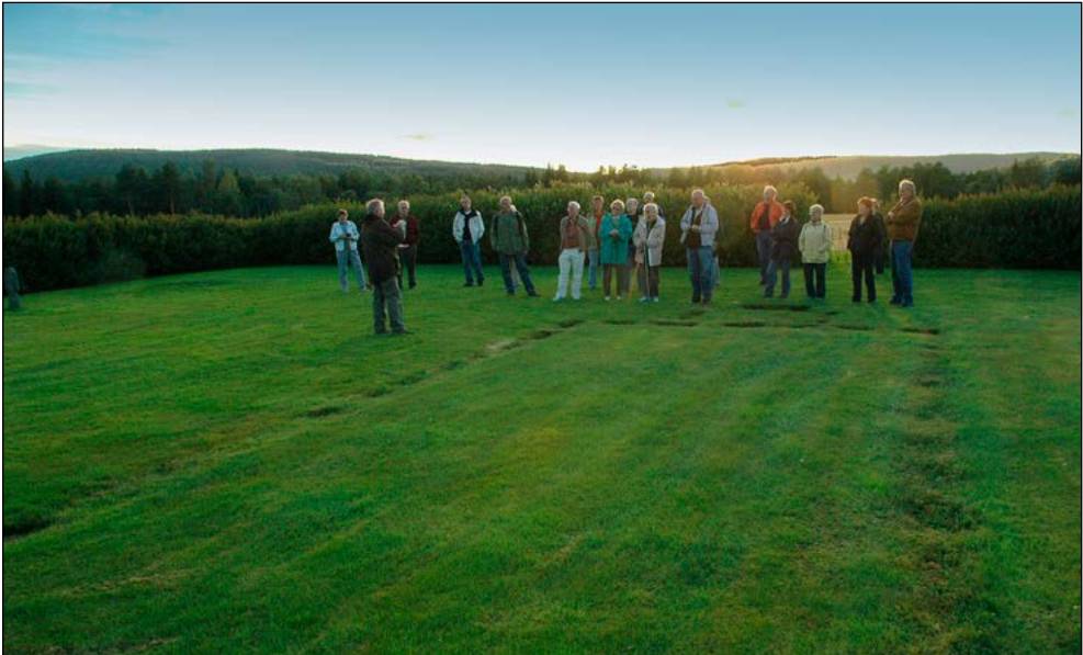
Jugramo en sommerkveld i 2009.

Først i 1680 er det nye opplysninger av betydning i regnskapene. Det er vanskelig