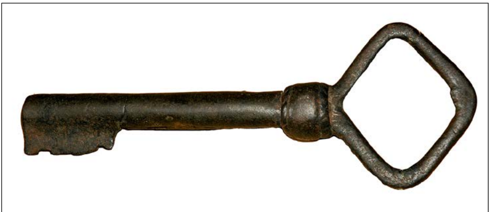
Nøkkelen til den gamle kirken på Sand.

Det finnes ingen lister eller oversikter over kirkene fra den tidligste kristne tiden i Norge, det vil si fra 1000-tallet av og et par århundrer fremover. Det er først mot slutten av 1300-tallet vi begynner å få et visst grep. Dette skyldes nok flere forhold, men særlig ett: Skriftkulturen ble i stor grad innført sammen med kristningen, og det tok lang tid før statlige og kirkelige myndigheter hadde opparbeidet seg en større, profesjonell administrasjon. Vi ser at de skriftlige kildene som dukker opp tidligst, ofte hadde å gjøre med behovet for å holde rede på eiendomsforhold knyttet til gårder og gårdparter. Slik er det også med Nord-Odal. Den første skriftlige kilden som omhandler gårder i Nord-Odal er kong Håkons gavebrev fra 1306, hvor det nevnes en håndfull gårdparter i Odal som ble gitt av kongen til Mariakirken i Oslo (DN II, nr. 83). Fra 1331 er det et brev om eiendomsgrensen mellom Ekornhol og Stein. Opplys-