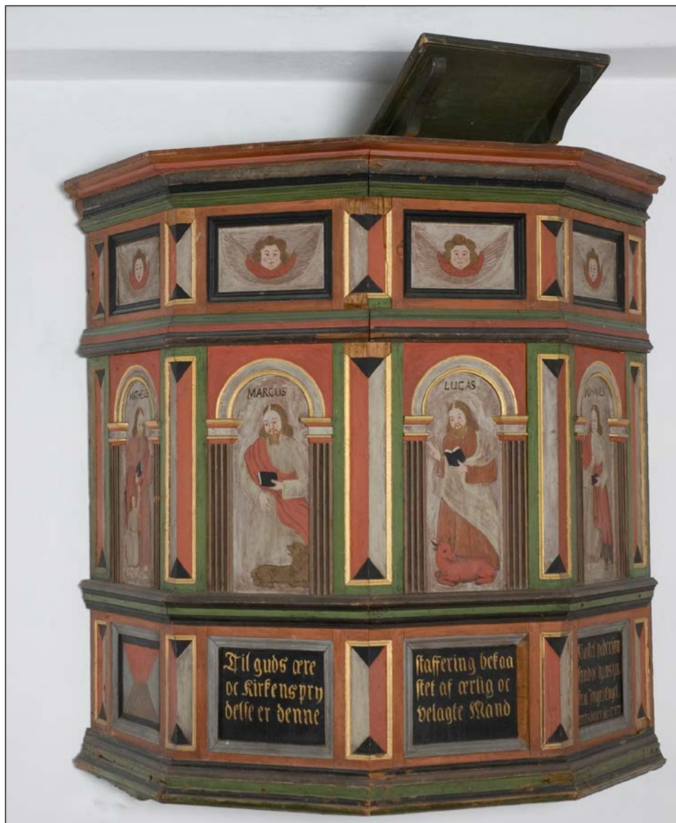
Prekestolen fra den gamle kirken i Mo.

Da Sand og Mo kirker havnet i menighetens eie på 1800-tallet, var det nok så som så med tilstanden. Sand kirke ble reparert noe i 1851-53, men i 1889 gikk det for alvor mot slutten for den gamle kirken, da det ble bestemt å bygge en ny. I januar 1891 ble den revet. Takstein ble solgt – den hadde altså på et tidspunkt fått takstein i stedet