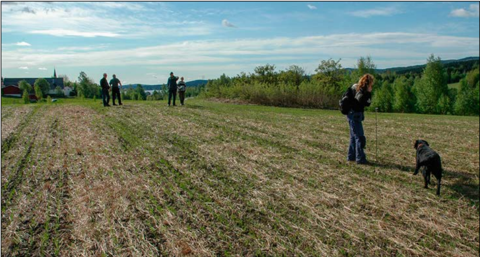
Fra en befarung på Visbølbakken i 2008.

Vi må opp til 1600-tallet før vi får nærmere opplysninger om kirkebygningene, men da får vi til gjengjeld et ganske godt innblikk i «dagliglivet» i kirkebygningene