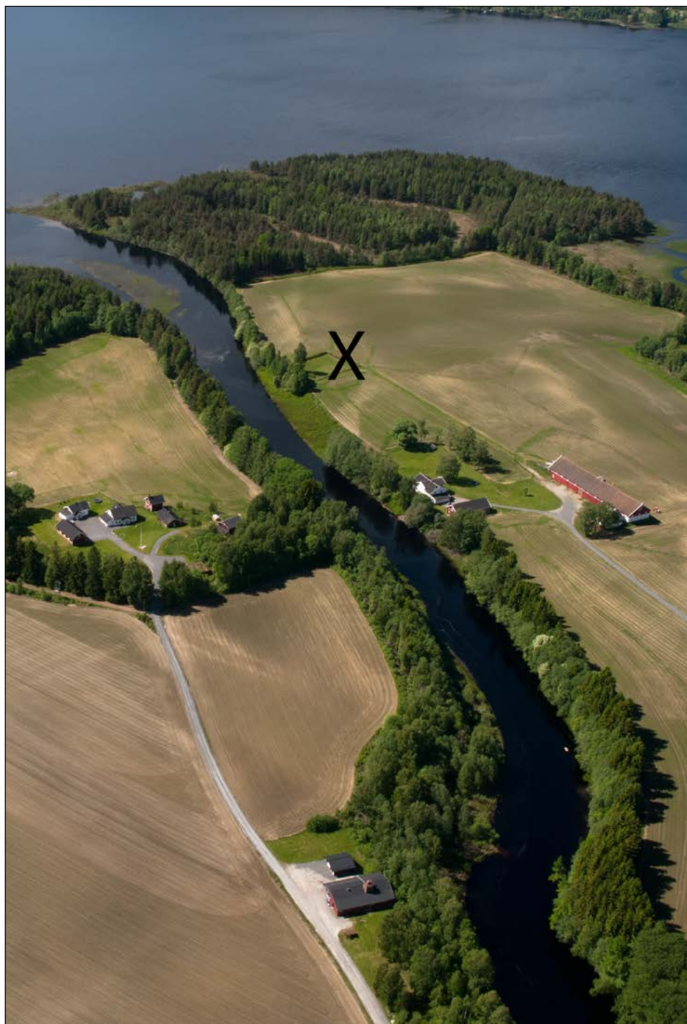
Jugramo ligger rett sør for Stormoen, like inntil Juråa.